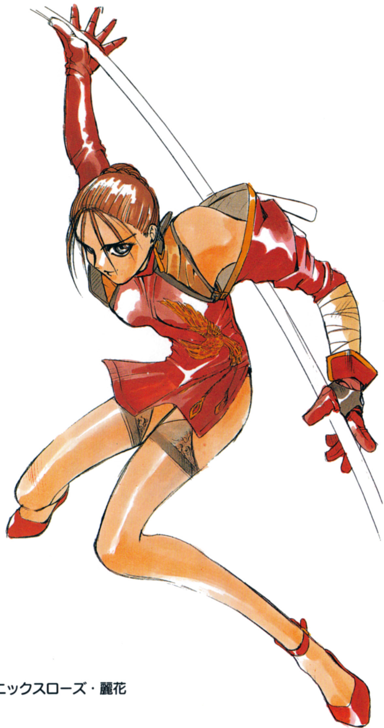
フェニックスローズ・麗花